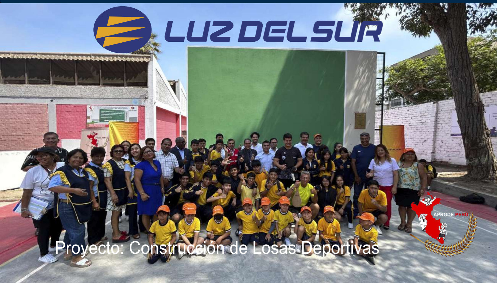
Proyecto: Construcción de Losas Deportivas